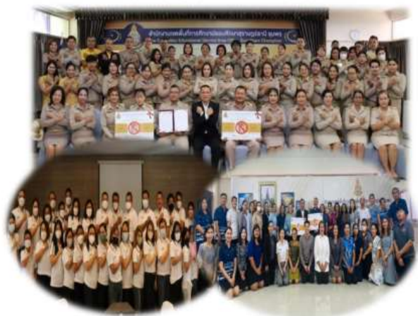
สำนักงานคณะกรรมการการศึกษาขั้นพื้นฐาน กระทรวงศึกษาธิการ

รายงานการวิเคราะห์ความเสี่ยงของการปฏิบัติงาน ที่อาจก่อให้เกิดการทุจริตและผลประโยชน์ทับซ้อน สำนักงานเขตพื้นที่การศึกษามัธยมศึกษาสุราษฎร์ธานี ชุมพร ประจำปีงบประมาณ พ.ศ. ๒๕๖๖